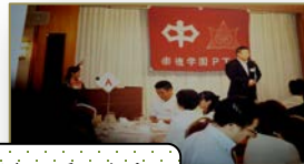
平成26年度 第2地区懇談会